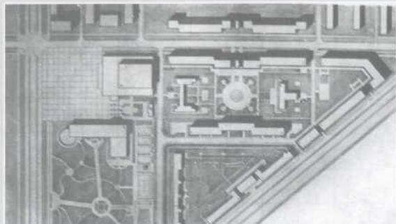
▲ Фрагмент проекта застройки центральной части Сталинска, 1934 (вверху – жилой дом-гигант)