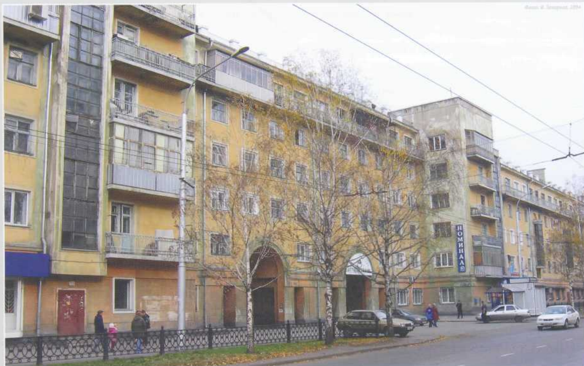
Фото: В. Заварзин, 2004