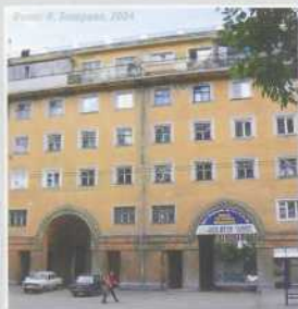
Фото: В. Заварзин, 2004