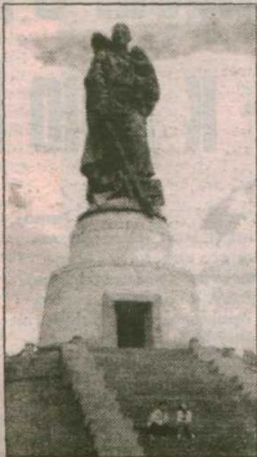
насыпанного на месте братской могилы.

Кстати, памятник, в котором увековечен подвиг Н.И. Масалова, вновь занял свое место на постаменте в берлинском Трептов-парке. Семь месяцев он был на реставрации. 42-тонный бронзовый колосс установлен на холме братской могилы, где похоронены 200 советских солдат. Реставрационные работы на постаменте еще продолжаются, так что венки и цветы в честь праздника Победы — в Германии 8 мая отмечают как день освобождения от фашизма — возлагали прямо к подножию холма,