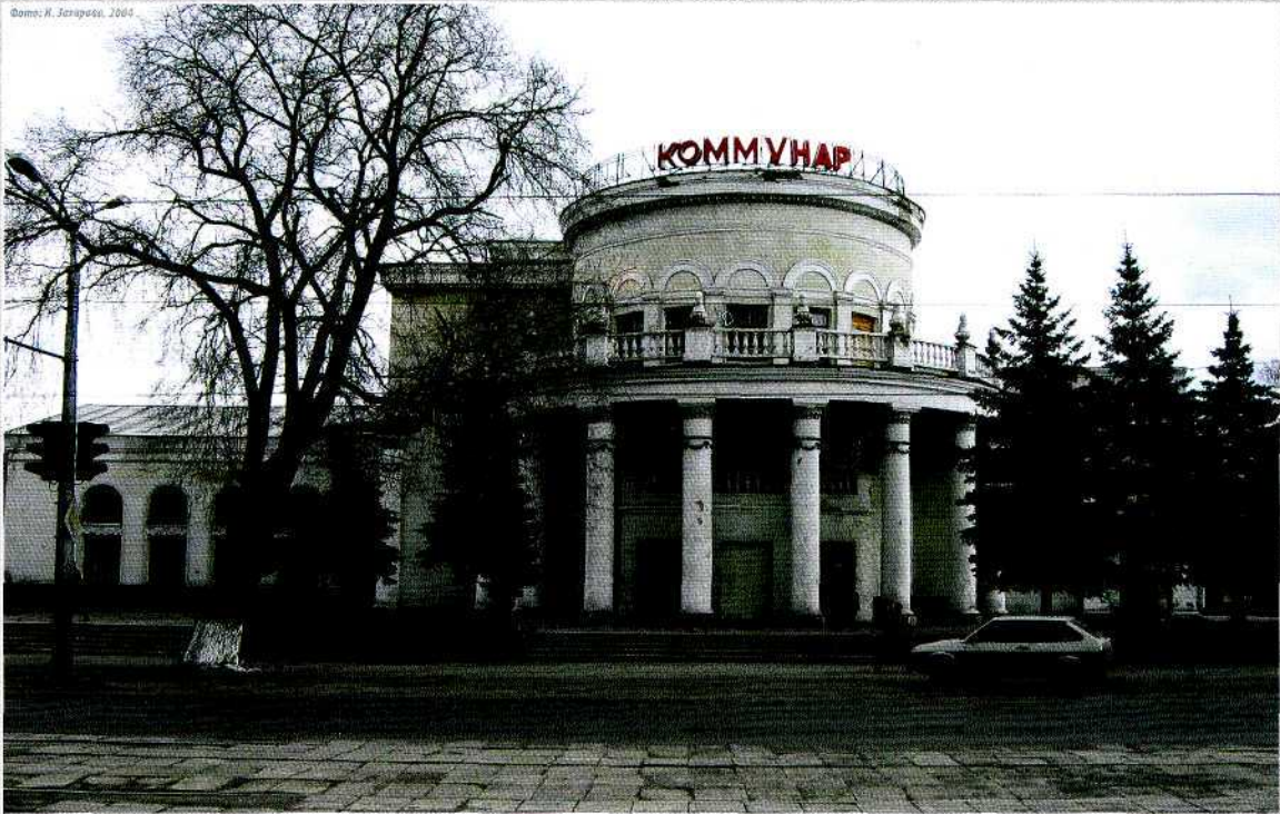
▲ Г. Козель. Кинотеатр «Коммунар». 1933